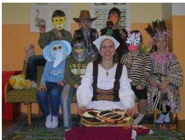
Připravila: Jiřina Ciglerová